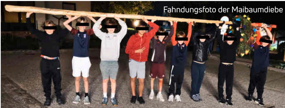
Fahndungsfoto der Maibaumdiebe