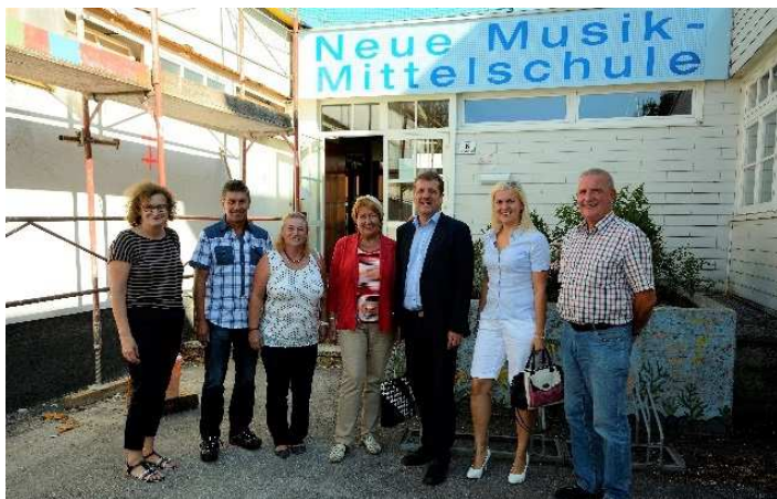
2015: Lokalausweis bei der Turnsaal- und Schulküche-Sanierung

Nichtdestotrotz laufen die Vorbereitungen dafür in verschränkter Weise und wir konnten in der letzten GR-Sitzung den Auftrag für die Generalsanierung der NMS an die OÖ Wohnbau mit einem Planungsentwurf samt Kostenschätzung und Workshop bzw. pädagogischer Prozessbegleitung beschließen.