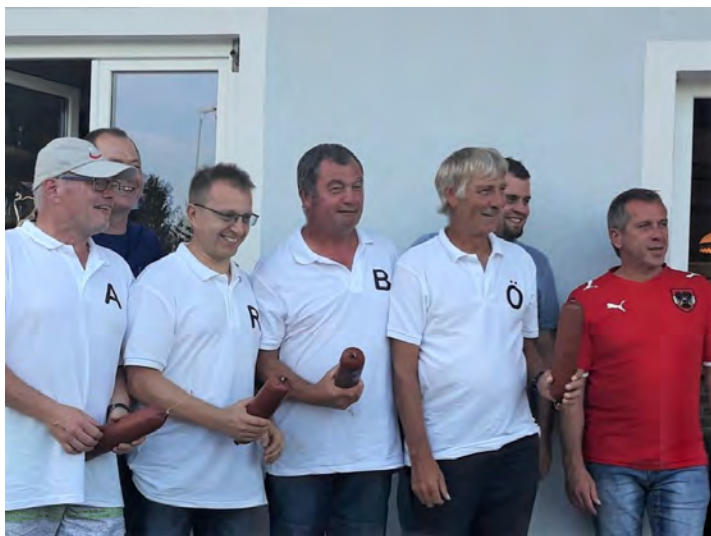
7. Platz von 22 Mannschaften bei der Ortsmeisterschaft im Stockschießen

Ich wünsche eine schöne, unfallfreie Wintersaison. Genießen Sie die Bergwelt, sie bietet Erholung und Entspannung. Einfach die Seele baumeln lassen.