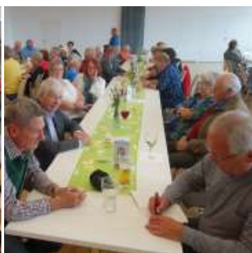
Muttertags- u. Vatertagsfeier