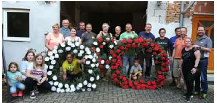
Die Maibaumkranzbinder haben ganze Arbeit geleistet!