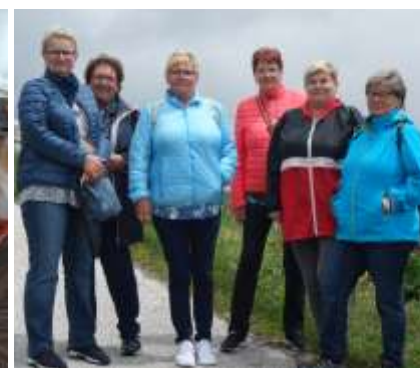
Kleine Wanderung am Loser