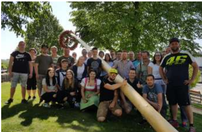
Das bunt gemischte Maibaumaufstell-Team