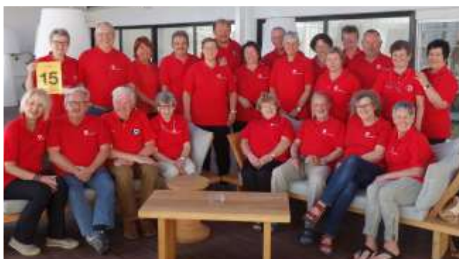
Die Reisegruppe in Zypern