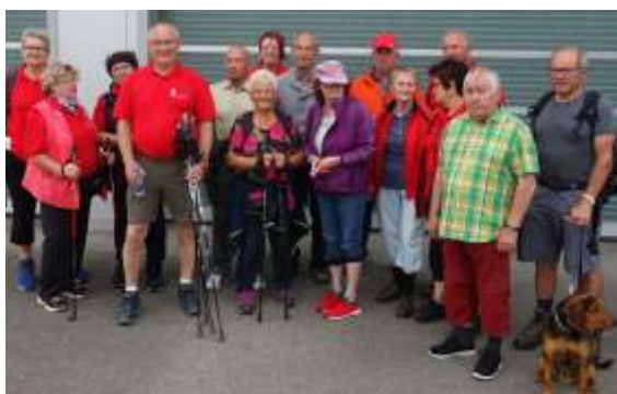
Bezirkswandertag in St. Marien