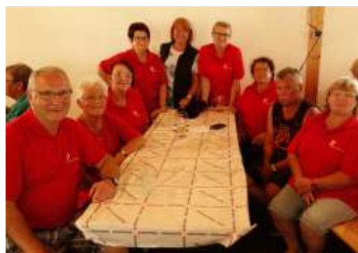
Spiel. Wettbewerb in Nettingsdorf