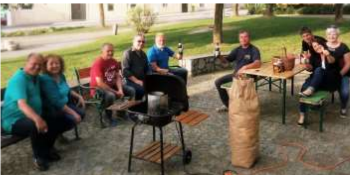
Die braven Maibaumbewacher haben gut auf unsere zwei Maibäume aufgepasst!